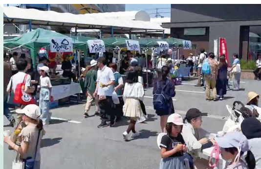
わくわくフェスタの様子