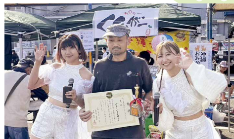
第1位に輝いたパーラーくっくるがーさん