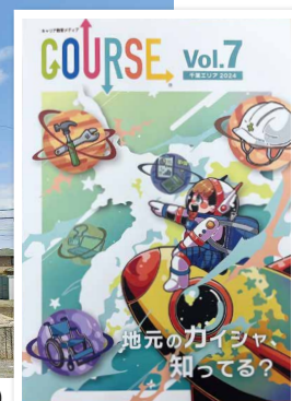
▲ 地元就職ガイドブック