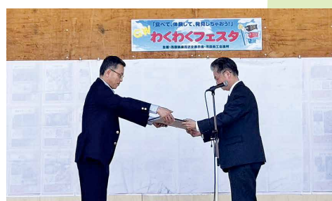
オープニングセレモニーの様子