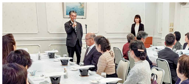
秋葉会頭挨拶の様子