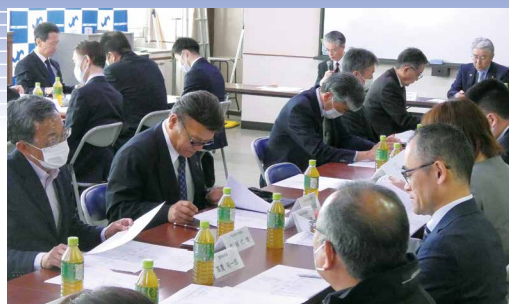
茂原七夕まつり実行委員会の様子

4月24日(水)、第70回茂原七夕まつり実行委員会を開催しました。 今年では記念すべき第70回を迎えます。恒例の「もばら阿波おどり」や「YOSAKOI夏の陣」などの人気イベントの他、街を彩る「飾り」など、「見て、来て、参加して楽しい」2日間となるよう鋭意準備を進めております。 皆様、どうぞ楽しみにお待ちしております！