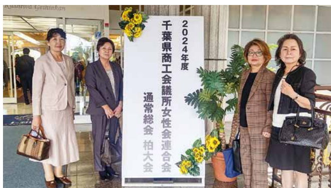
会場玄関前での写真

6月5日(水)ハート柏迎賓館で開催された県商女連通常総会(柏大会)に4名で参加しました。その後の懇親会では、他女性会と交流を深めながら、有意義な時間を過ごしました。