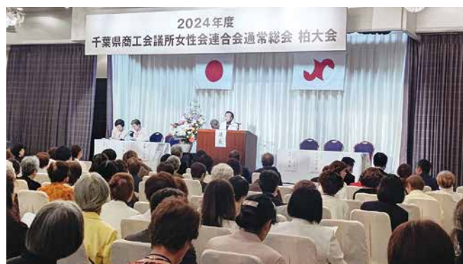
県商女連通常総会(柏大会)の様子