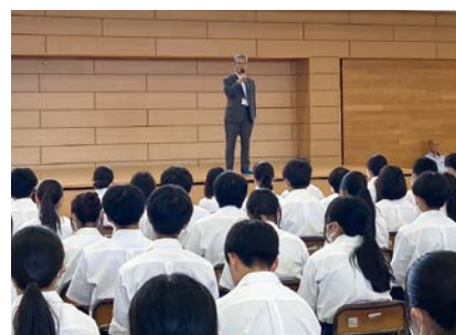
秋葉会頭による挨拶

(有)アズマヤ、(有)さわだ貸衣裳店、(株)さくら印刷、(有)ルミエール、社会福祉法人長生共楽園、東洋ケミカルエンジニアリング(株)、(株)山崎組、御園建設(株)、KOKOMO保育園、K&Oエナジーグループ(株)、(株)小沢工務店、(有)トラスト保健センター、茂原市役所、JR東日本 茂原駅、筆文字家だいぞう、茂原ショッピングプラザアスモ、Catering & Restaurant OTTO、昌和プラスチック工業(株)、みかわや、茂原商工会議所