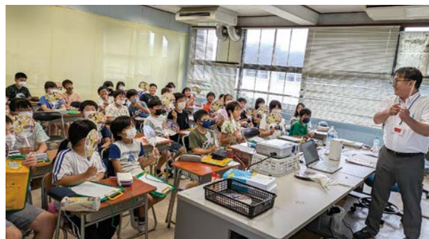
茂原七夕まつりの歴史を学ぶ5年生(茂原小学校)