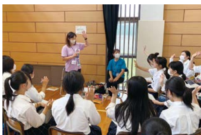
座談会の様子(KOKOMO保育園)