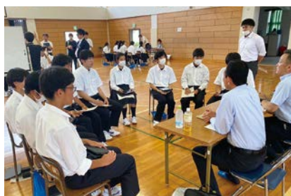
座談会の様子(JR東日本茂原駅)