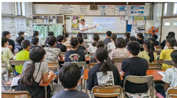
茂原市の産業について学ぶ6年生(茂原小学校)