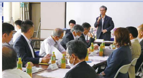
茂原七夕まつり実行委員会の様子

記念すべき第70回に向けてさまざまなイベントが企画されておりますので、是非お越しください！