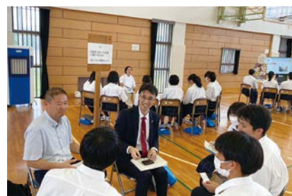
座談会の様子(有)トラスト保険センター)